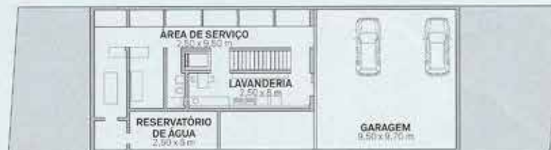
PAVIMENTO INFERIOR: 215 m 2