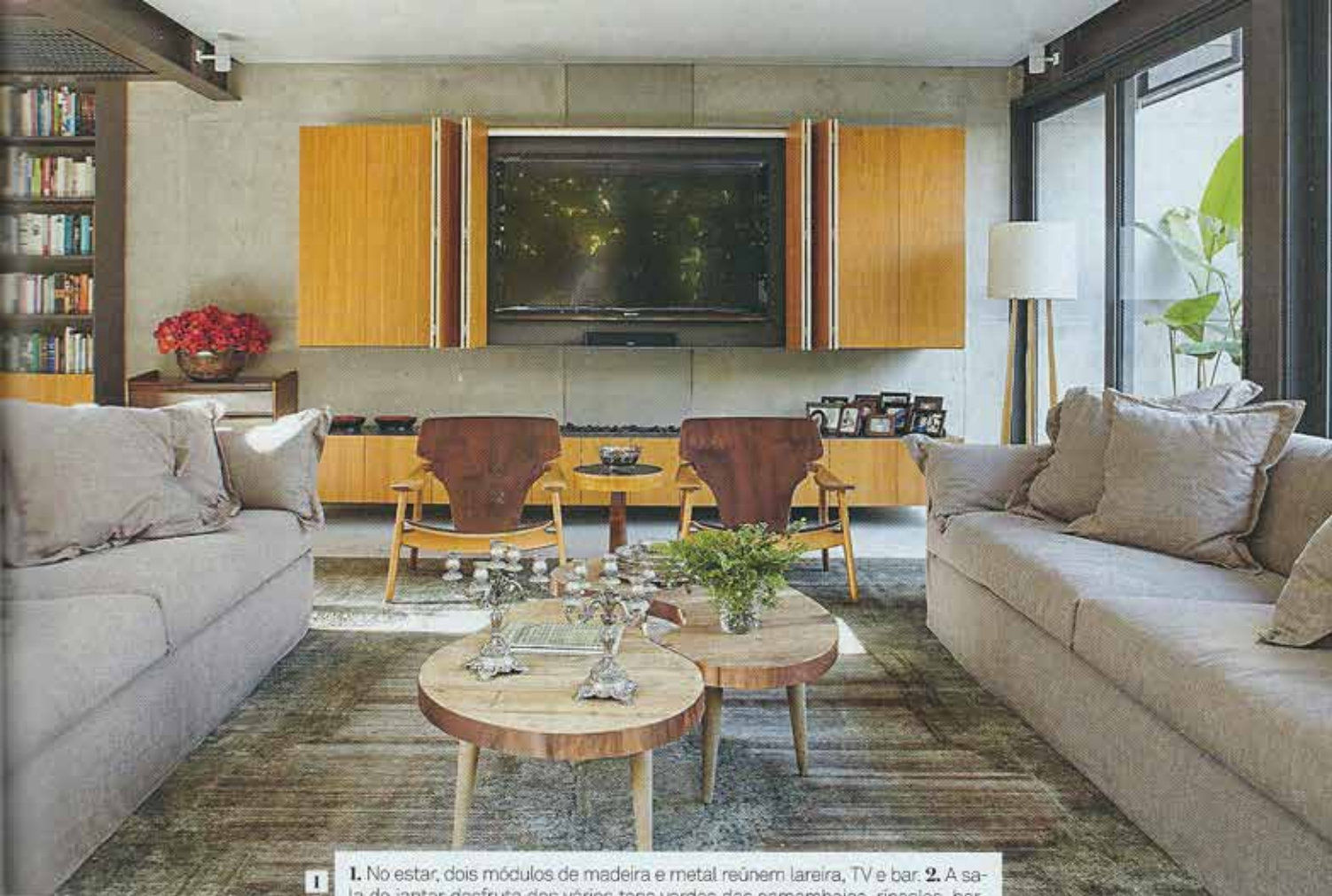
1 No estar, dois módulos de madeira e metal reúnem lareira, TV e bar. 2 A sala de jantar desfruta dos vários tons verdes das samambaias, ripsales, barbigas-de-sapo e outras espécies, além de contar com uma tela de Marina Salerne e um lustre Poppy (FAS). 3 O lavabo tem pia de Corian (Avitá Design).