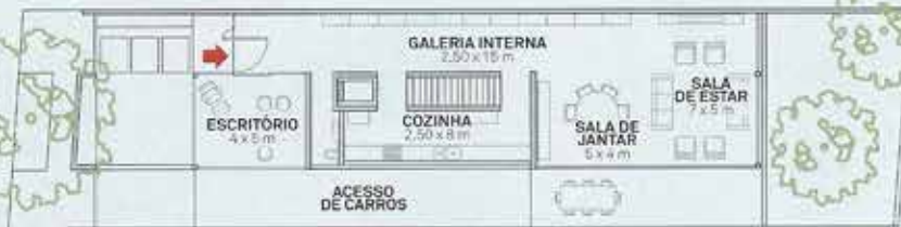
TÉRREO: 170 m 2