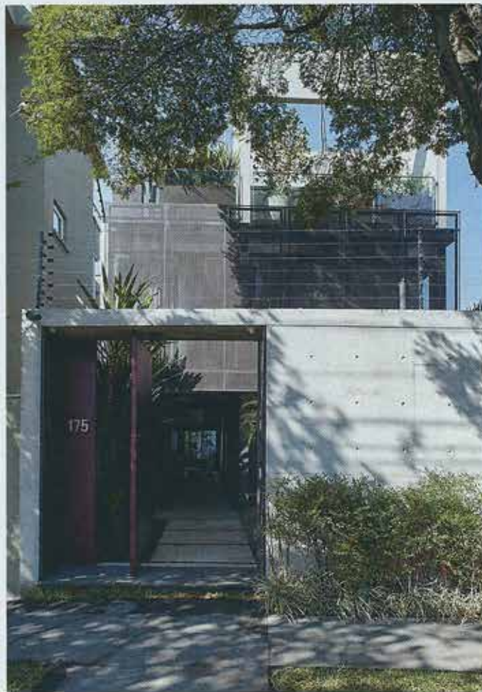
Da rua se veem apenas o muro de concreto e o brise perfurado cobrindo parte da fachada. Só se adivinha o interior ao abrir o portão.

Com a experiência de já ter passado por outras empreitadas e o bom senso da maturidade, o casal entregou aos arquitetos uma lista daquilo que lhe era essencial: uma suíte para a mulher e outra para o marido, estante com capacidade para 2,5 mil livros, solário, academia de ginástica, elevador, suíte de hóspedes, lareira a gás, gerador de energia e garagem para seis carros (coubaram quatro). “Era um programa muito extenso para a área, mas resolvemos tudo em quatro pavimentos, um deles no subsolo”, explica Alvaro. “A galeria com a biblioteca dá a noção de espacialidade, indo do térreo à cobertura e desde a frente até quase os fundos.”