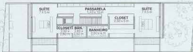
PRIMEIRO PAVIMENTO: 145 m 2